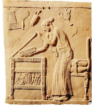
Doc. 8 p. 51 : Une femme athénienne à la maison (Bas-relief du V e siècle avant J.-C., Musée national, Tarente)

D'après Aristote, Politique , IV e siècle av. J.-C.