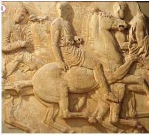
Doc. 4 p. 59 : Jeune citoyen à cheval (Fragment de la frise des Panathénées, V e siècle avant J.-C., Musée de l'Acropole, Athènes)

Au V e siècle avant J.-C., Athènes est peuplée d'environ 250 000 habitants répartis comme suit :