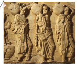
Doc. 4 p. 59 : Métèques portant des amphores (Fragment de la frise des Panathénées, V e siècle avant J.-C., Musée de l'Acropole, Athènes)

D'après Pseudo-Xénophon, Gouvernement des Athéniens , IV e siècle av. J.-C.