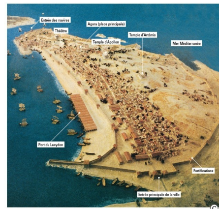
La ville est protégée par un rempart. L'entrée principale, au premier plan, ouvre sur la rue principale qui sépare la ville en deux. Le port était très actif.